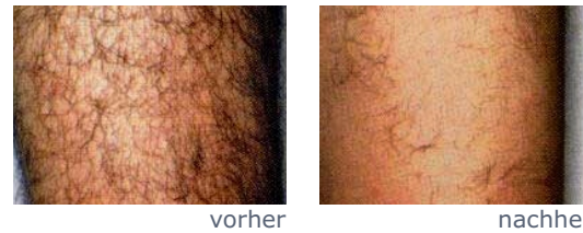
ELOS-Epilation: Beine, Behandlungsergebnis nach der zweiten Behandlung