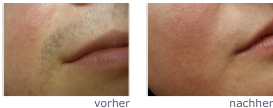
ELOS-Epilation: Behandlungsergebnis Oberlippe