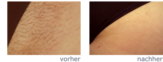
Elektro-Epilation: Behandlungsergebnis Bikini-zone, 3 Jahren nach letzter Behandlung

Bei der Behandlung durch ausgebildete und professionell arbeitende ElektrologistInnen sind aufgrund der Berücksichtigung individueller Behandlungssituationen Nebenwirkungen nicht zu erwarten. Darüber hinaus erhalten Sie die notwendigen Informationen, was Sie selbst vor und nach der Elektro-Epilation beachten sollen.