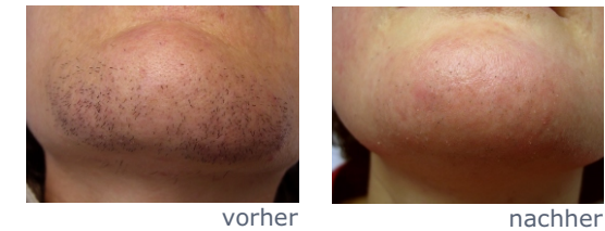
ELOS-Epilation: Behandlungsergebnis am Kinn nach 6 Behandlungen.

Das Ergebnis soll permanent sein. Die Elektroepilation ist unabhängig von der Haarfarbe, Haarstärke und Hautfarbe. Bereits vor 125 Jahren wurde die Elektroepilation in den USA erstmals angewendet und im Laufe der Jahre technisch weiter entwickelt und verfeinert. Inzwischen wird die Elektro-Epilation auch in Deutschland mit größtem Erfolg praktiziert.